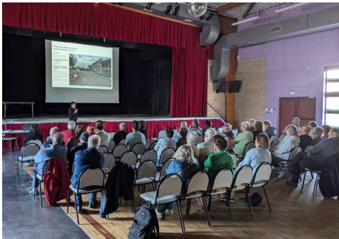
La présentation du matin, qui a aussi permis de faire le point sur l'avancement du projet de restauration de l'église

Ces échanges riches et fructueux nous ont permis de vérifier certaines propositions, mais également de mettre en lumière des sujets et des thèmes à approfondir dans le projet, soit à l'étape Plan-Guide, soit ultérieurement lors de son développement plus précis.